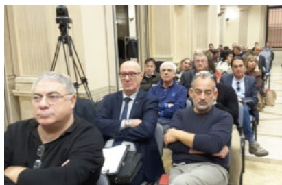
foto di sala